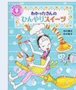
2. わかったさんのひんやりスイーツ