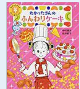
3. わかったさんのふんわりケーキ